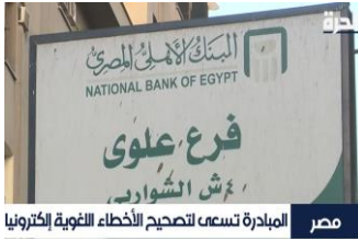
مصر المبادرة تسعى لتصحيح الأخطاء التقنية الإلكترونية

وقد تم توضيح عدم اهتمام المصريين باللغة العربية، كجزء من هويتهم بإظهار العديد من الأخطاء اللغوية في اللافتات المتواجدة في الشوارع، وتفضيل المحلات لاختيار أسماء لها بالإنجليزية عن العربية التي هي أساس وجزء رئيسي من الهوية المصرية، وقد تم استخدام اللقطات القريبة Close Up Shots لتوضيح تفاصيل ذلك: