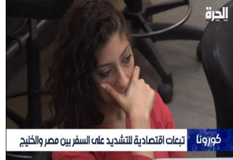
كورونا تبعات اقتصادية للشديد عام السفر بين مصر والخليج

دعمت العديد من اللقطات إطار التعاون والإندماج :