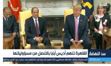
سد النهضة القاهرة تتهم أديس أبابا بالتصل من مسؤولياتها

فقد تم توظيف اللقطات في التأكيد على إيجابيات الولايات المتحدة الأمريكية، والجوانب المشتركة بين مصر وأمريكا، خاصة التعاون من أجل مكافحة الإرهاب، وأنها تقوم بدور الوسيط العالمي بين مصر وإثيوبيا لحل أزمة سد النهضة: