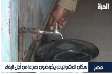
مصر سكان العشوائيات يخوضون صراعا من أجل البقاء

فالتركيز على مشكلة العشوائيات تم استخدام أحجام ولقطات متنوعة لسكان المناطق العشوائية لبيان المعاناة التي يعاني منها سكان العشوائيات وتوضيح أنها بيئة غير آمنة للعيش الأدمي، وتوضيح في خلفية الرجل آثار حطام وقمامة بجوار بقايا السرير الذي يجلس عليه، ولقطات قريب Close Shot توضح